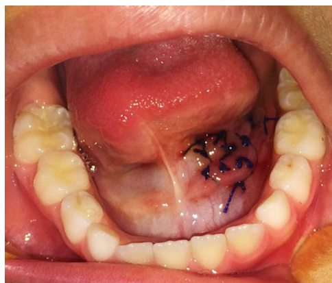
Figura 6 - Micromarsupialização