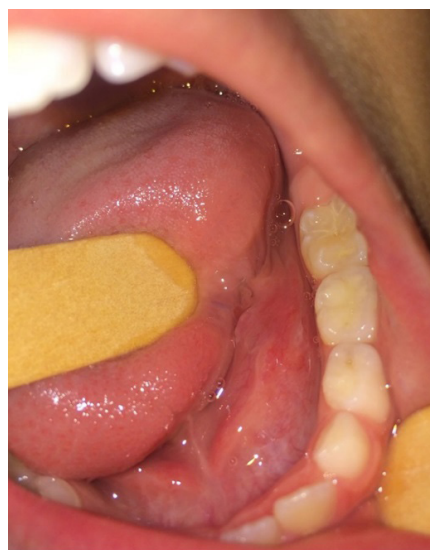
Figura 7 - Com 30 dias de pós-operatório, demonstrando resolução total da rânula