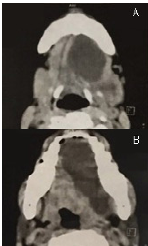
Figura 4 - (A e B) Aspecto tomográfico da lesão. Nota-se imagem hipodensa, compatível com conteúdo salivar, em região sublingual, que se estende para o espaço submandibular esquerdo. Observar desvio de via aérea superior

Com base nos aspectos clínicos, na história atual da doença e nos exames solicitados, chegou-se ao diagnóstico final de rânula mergulhante. O paciente foi submetido à drenagem por meio de punção aspirativa da tumefação intraoral, a fim de diminuir a pressão do fluido intralesional sobre a sua via aérea, com coleta de 30 ml de material de coloração levemente amarelada, compatível com material mucoseroso (figura 5). Essa manobra permitiu regressão significativa da lesão. Quatro dias após a punção inicial, foi realizada a técnica de micromarsupialização, sob anestesia local e fio reabsorvível à base de poliglactina 910 (Vicryl®) (figura 6).