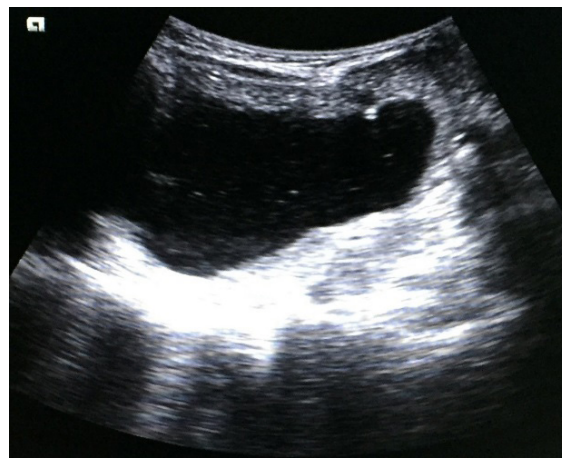
Figura 3 - Ultrassonografia da lesão revelando formação cística de contornos definidos, porém irregulares, de origem em região sublingual