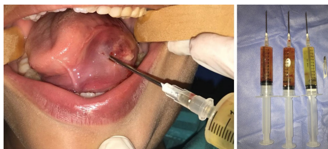
Figura 5 - (A) Punção aspirativa para drenagem do fluido intralesional; (B) coleta de aproximadamente 30 ml

O paciente segue em acompanhamento ambulatorial de seis meses, sem sinal de recidivas da lesão (figura 7).