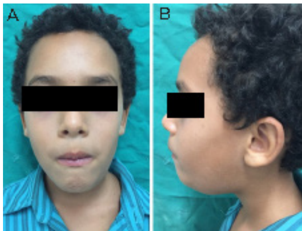
Figura 1 - Aspecto extraoral do paciente, com presença de tumefação submentoniana e submandibular esquerda. Observar selamento forçado dos lábios

Paciente de sexo masculino, 7 anos de idade, melanoderma, compareceu ao serviço de cirurgia e traumatologia bucomaxilofacial do Hospital da Restauração, em Recife (PE), acompanhado de sua genitora, com queixa de aumento de volume extenso em região intraoral, submental e submandibular esquerda havia aproximadamente uma semana. À anamnese, a genitora relatou que o paciente não possuía hábitos nem alergias. A história médica e familiar não revelou alteração digna de nota. Ao exame físico extraoral, o paciente apresentava aumento de volume em região submental e submandibular esquerdo, flutuante à palpação, sem sintomatologia dolorosa associada. Incompetência labial também estava presente (figura 1).