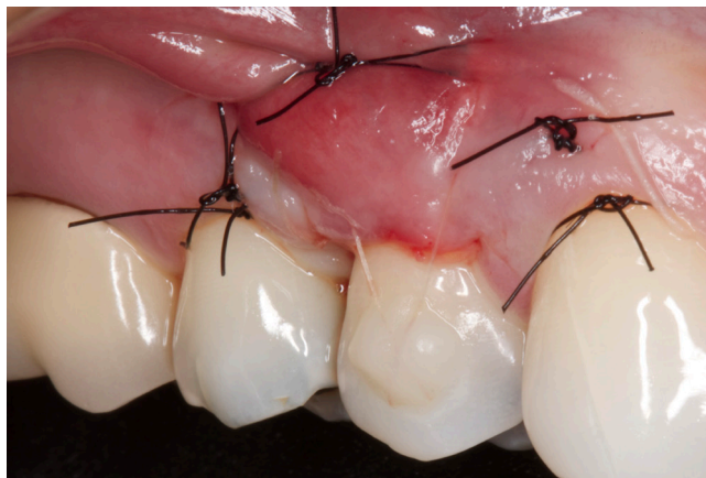
Figura 6 - Estabilização do enxerto com pontos simples e suturas suspensórias ancoradas nas faces vestibulares dos dentes com resina

No pós-cirúrgico a paciente foi orientada a evitar qualquer trauma mecânico e não realizar por duas semanas escovação nos dentes envolvidos no procedimento cirúrgico. A paciente recebeu um comprimido analgésico sublingual (Toragesic) imediatamente ao fim da cirurgia e recebeu como prescrição pós-operatória: ibuprofeno 600 mg e bochechos com digluconato de clorexidina 0,12%, duas vezes ao dia (12 em 12 horas), durante duas semanas.