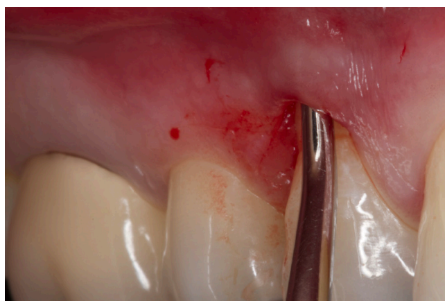
Figura 3 - Descolamento mucoperiosteal do tecido vestibular (retalho total), estendendo-se além da junção mucogengival, mantendo-se as papilas íntegras e aderidas

Como região doadora escolheu-se o palato. Para a remoção do enxerto, recorreu-se à técnica linear e dupla divisão, ou seja, a primeira incisão