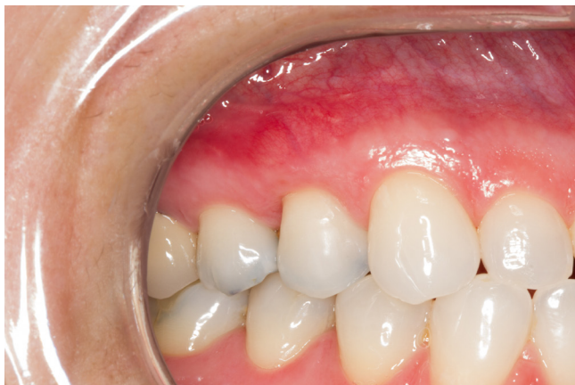
Figura 8 - Pós-operatório com 1 ano

Posteriormente, com 1 ano de pós-operatório, o ganho de mucosa queratinizada é mais evidente e verifica-se a estabilidade dos resultados obtidos (figura 8).