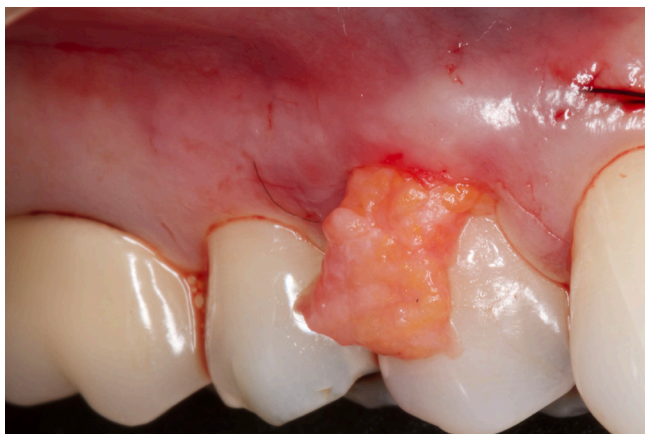
Figura 5 - Enxerto de tecido conjuntivo sendo tunelizado com auxílio de fio de sutura

O enxerto de tecido conjuntivo subepitelial foi inserido na área receptora através do túnel, com a auxílio de um fio de sutura (figura 5) estabilizado com pontos simples na mesial e na distal, além de suturas suspensórias complementares para ajudar ainda mais na estabilização do enxerto, realizadas com fio de náilon 5.0 (Techsuture®), ancoradas nas faces vestibulares dos dentes com resina flow (Opallis Flow FGM®). Depois foi realizado preparo utilizando condicionamento com ácido fosfórico 37% e adesivo, com o intuito de tracionar e estabilizar tanto o retalho quanto o enxerto em direção coronal (figura 6).