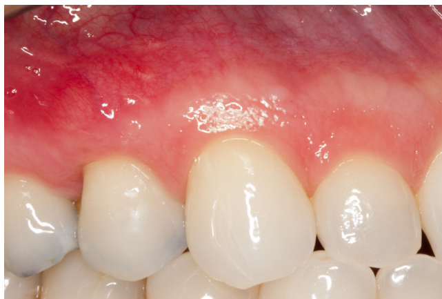
Figura 7 - Pós-operatório com 6 meses

Com 6 meses de pós-operatório observa-se um recobrimento total da recessão do dente 14, além do ganho de espessura tecidual e faixa de gengiva queratinizada (figura 7).