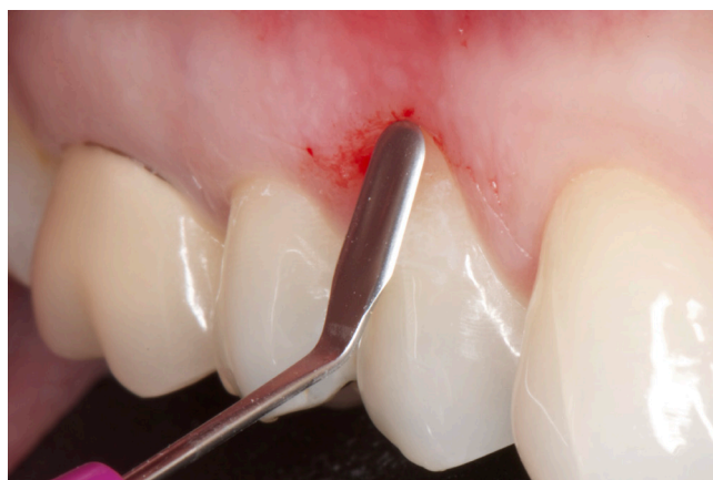
Figura 2 - Bisturi oftálmico, instrumento de microcirurgia que permite a manipulação mais atraumática do tecido para realizar o túnel no leito receptor

Iniciou-se o procedimento cirúrgico pela preparação da área receptora. A raiz foi raspada com curetas de Gracey 5/6 (Hu Friedy®), e efetuou-se descontaminação com PrefGel Straumann®. Em seguida, com auxílio do tunelizador e bisturi oftálmico (Surgistar®), que permitiram uma manipulação tecidual mais atraumática (figura 2), foi feito o descolamento mucoperiosteal do tecido vestibular (retalho total), estendendo-se além da junção mucogengival, mantendo-se as papilas íntegras e aderidas (figura 3).