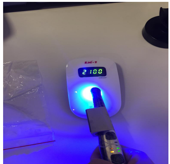
Figura 4 - Medição direta no aparelho