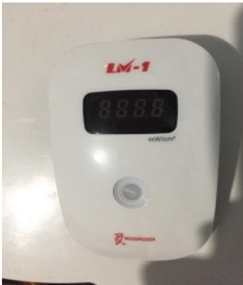
Figura 1 - Radiômetro Woodpecker, modelo LM-1