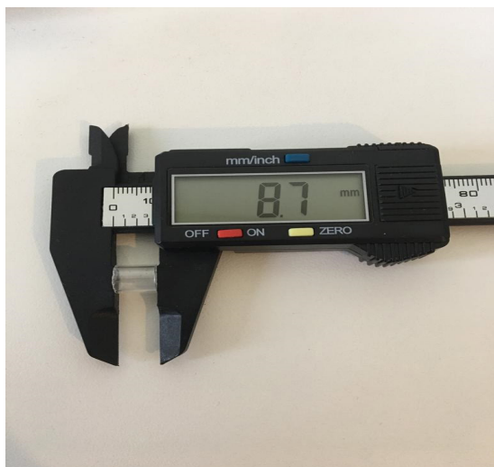
Figura 3 - Anéis de vidro de diferentes espessuras