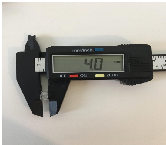
Figura 2 - Anéis de vidro de diferentes espessuras