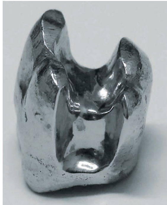
Figura 1 - Fotografia do modelo mestre fundido em liga de níquel-cromo

Em primeiro molar superior direito de acrílico (Columbia Dentform Corp., EUA) realizou-se um preparo tipo inlay MOD com paredes divergentes em 12° da cervical para a oclusal, ângulos arredondados e sem bisel. A profundidade da caixa oclusal foi de cerca de 2 mm e nas caixas proximais de 3,5 mm, com um istmo oclusal de metade da distância intercuspídea. Desse padrão conseguiu-se por inclusão em revestimento (Micro-Fine 1700 Talladium, EUA) e posterior volatilização da resina em forno elétrico (EDG) um modelo mestre fundido em liga de níquel-cromo (Fit Cast V Talladium, EUA) (figura 1).