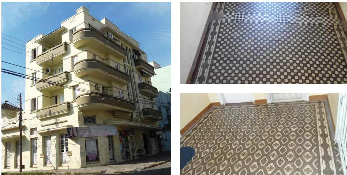
Figura 8 – Edifício Ibirapuitan e os ladrilhos hidráulicos nos corredores do prédio