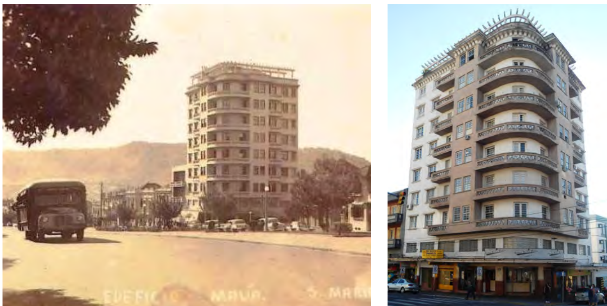
Figura 2 – Edifício Mauá, durante sua construção na Avenida Rio Branco (esquerda) e em registro recente (direita)