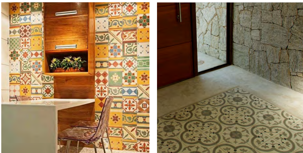
Figura 6 – Exemplos de uso de porcelanatos com texturas de ladrilhos hidráulicos combinados a outros materiais