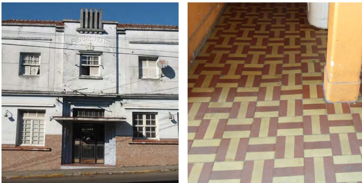
Figura 7 – Hotel Imperial é retrato do descaso com o revestimento em seu interior

Os ladrilhos hidráulicos são manifestações artísticas perdidas ou negligenciadas, em virtude da desconsideração e da falta de manutenção por parte de seus moradores para com as peças que ainda se conservam nos interiores das edificações em estilo art déco , os quais foram amplamente utilizados no período retratado.