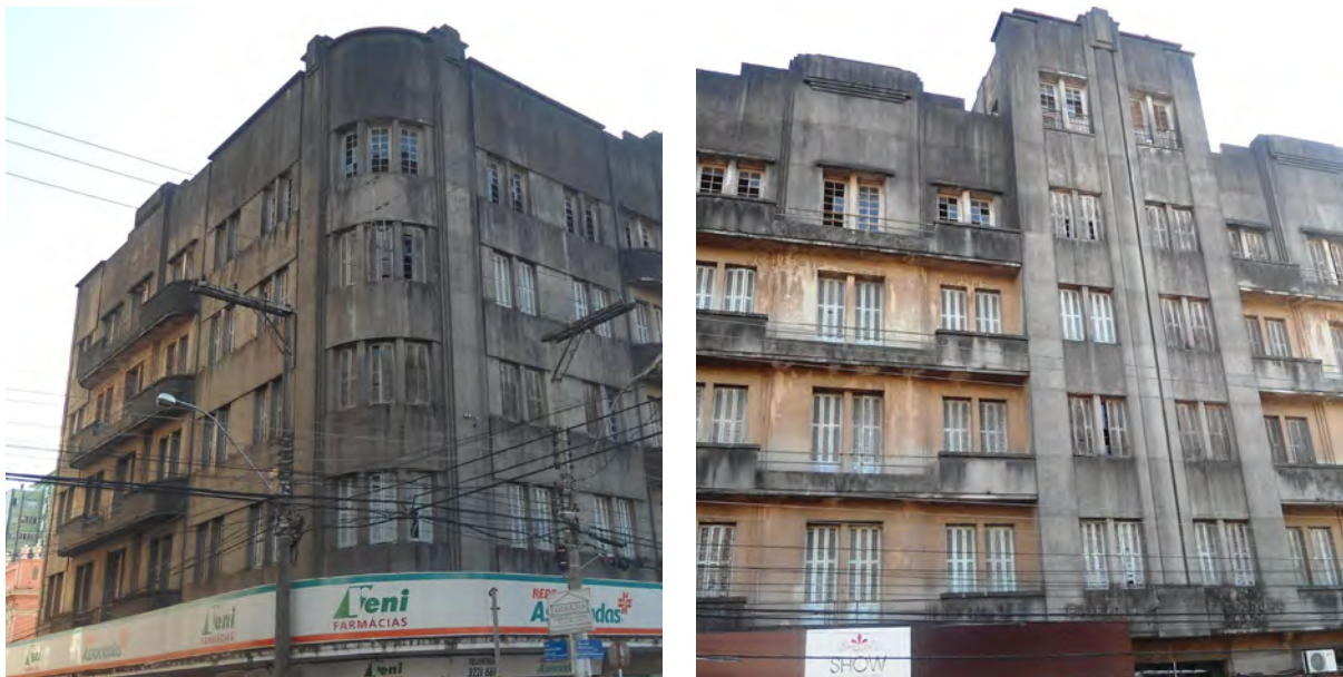
Figura 1 – Arquitetura art déco – antigo Hotel Jantzen, construído em 1940. Foi o primeiro prédio de quatro andares erigido em Santa Maria