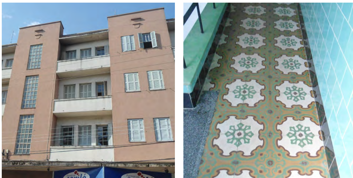
Figura 4 – Antigo posto de serviços Esso, com seus revestimentos de piso em ladrilhos hidráulicos bem conservados

Conforme Ruviano (2012), o art déco foi a princípio um estilo caracterizado pelo alto luxo e ornamentação formal, mas que em virtude da Grande Depressão 7 passou a valorizar também materiais e formas que poderiam ser produzidos em série, de modo fácil e econômico. Já Pevsner (1995) e Tambini (1999) asseguram que o art déco possui na arquitetura, nas artes plásticas, no design gráfico e industrial, nos objetos, no mobiliário, nos tecidos, na arquitetura de interiores, no vidro, na moda e no vestuário, ligados à vida cotidiana, suas manifestações mais significativas. Entre estas, encontra-se o ladrilho hidráulico, extremamente usado e bem-aceito na época e que atualmente volta a ser aplicado nos projetos de arquitetura.