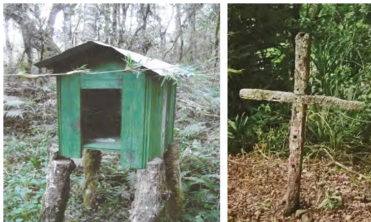
Figura 7 – Capelinha devotada ao Monge São João Maria; cruz demarcando sepultura não identificada no cemitério do Faxinalzinho – São Roque.

“Eu não tenho medo, eu nunca tive medo desses bichos... Mas às vezes... tem o gritador, aqui tem um gritador. [...] Ele grita, ele grita: ú, ú. Daí se começar a remendar ele vem em cima da gente. E é uma sombra, bem alto o gritador. Ih, é alto, é uma pessoa mas sabe que é alto, né. Alma perdida que diz” (Francisco de Souza, Comunidade Invernada dos Negros, 2008c).