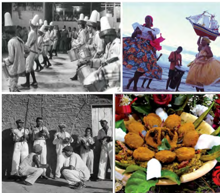
Figura 2 – Exemplos de patrimônio imaterial registrado como Formas de Expressão e Saberes

Ainda nos estados de Pernambuco, São Paulo, Maranhão, Rio Grande do Sul e Espírito Santo, outros instrumentos como a identificação e levantamento foram estabelecidos. Também tem grande importância a mobilização dos remanescentes das comunidades dos quilombos pelo reconhecimento da cultura afro-brasileira, uma vez que a certificação e