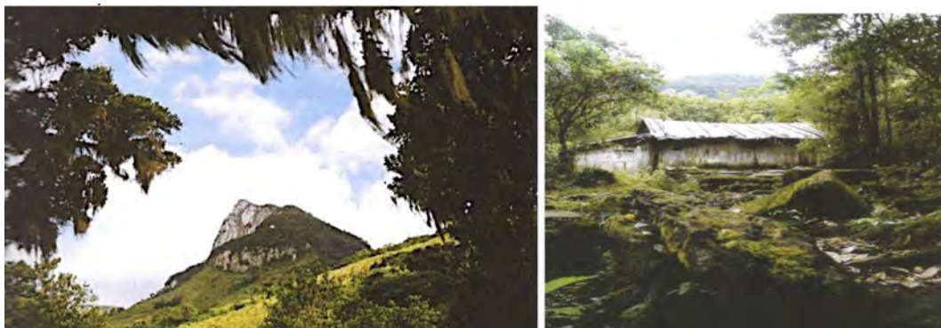
Figura 3 – Pedra Branca, face norte; entorno da residência de Dirceu e Vilson Nunes, localizada na parte alta do Rio Faxinalzinho – São Roque (lugares vinculados aos antepassados escravizados)

A ancestralidade também foi mencionada na divisão das terras entre as famílias e a organização espacial da comunidade, efetuada a partir de um modelo “herdado”, para