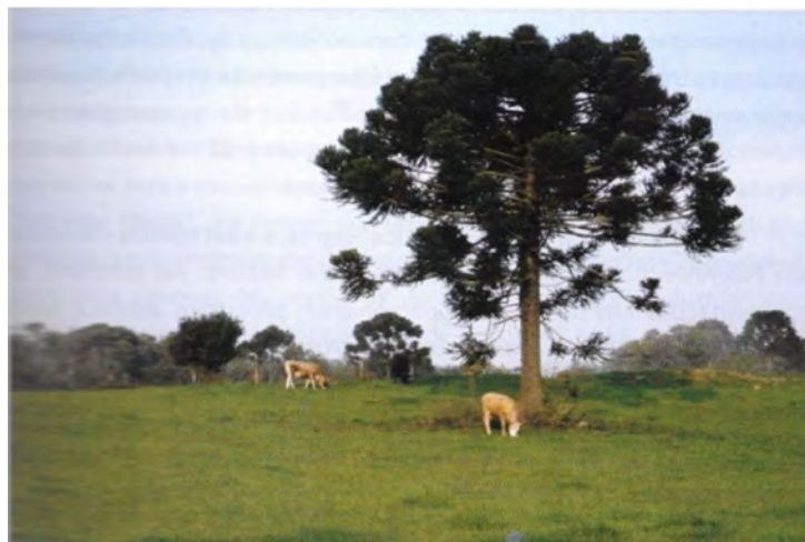
Figura 6 – Criação do gado solto – Invernada dos Negros.

Em Formas de Expressão, as fotografias também apresentaram uma ligação dos moradores com o meio simbólico, indicando lugares como os cemitérios e os enterramentos antigos, as igrejas e as capelas e pequenos artefatos como os rosários e as imagens religiosas (Figura 7). As narrativas mencionaram ainda o contato com seres extraordinários e eventos como as visagens. Presentes no cotidiano, para os moradores, esses seres se manifestam durante o dia, na lida com a roça, ou a noite, no retorno de um baile ou uma festa no