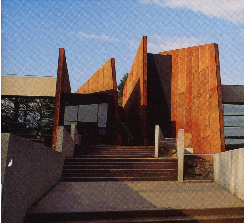
Figura 1 – Fachada do CMO