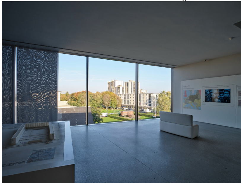
Figura 7 – Monumento com o Memorial de la Shoah de Drancy, com a fachada envidraçada