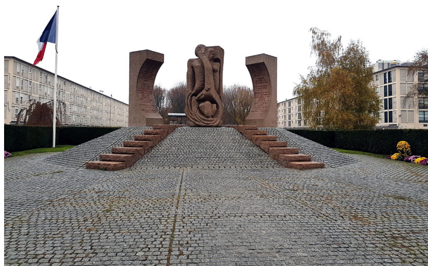
Figura 6 – Monumento de autoria de Shelomo Selinger e os prédios da Cité de la Muette

Após a Liberação 4 foi criada uma confederação de ex-internos vítimas do racismo, abarcando egressos de diversos campos, particularmente Drancy. Coube à confederação o papel de buscar e preservar a documentação referente aos campos, incluindo testemunhos de egressos de tais lugares, assim como cumprir a função de fomentadora de marcações desses locais no espaço público (Poznanski, 2022). As negociações para a construção de um monumento em Drancy avançaram no final da década de 1960, envolvendo discussões acerca da unicidade ou não de vítimas judias. Como coloca Poznanski (2022, p. 115), foi necessária a criação de um “Comitê de apoio para a construção de um monumento em memória às vítimas das perseguições raciais internadas no campo de Drancy, antecâmara dos campos de extermínio nazistas”. Em maio de 1976 foi inaugurado o monumento do artista Shelomo Selinger na entrada do complexo, erigido em granito rosa com altura de 3 m e 60 cm em um conjunto carregado de elementos do simbolismo religioso judaico no bloco central, ladeado por dois outros que representam as “portas da morte”, com inscrições em hebreu e francês (Poznanski, 2022, p. 116). Ainda compondo esse conjunto memorial, vê-se um marco com a bandeira da França hasteada e um vagão-testemunho ali instalado em 1988 (Lefevre, 2019).