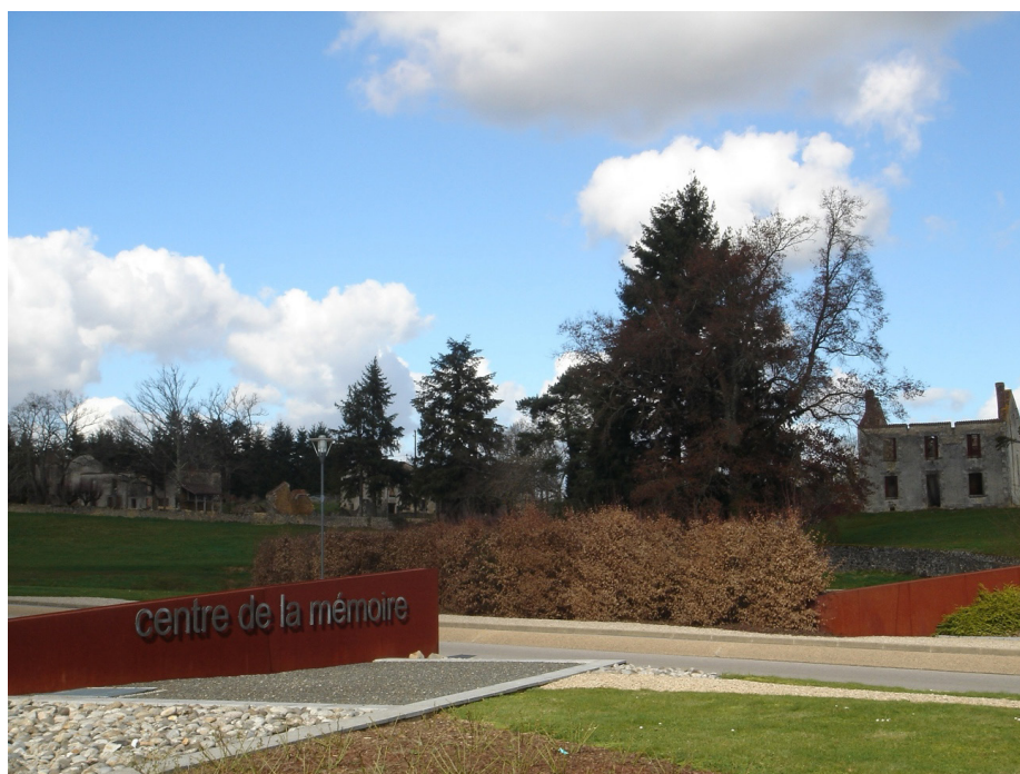
Figura 2 – Fachada do CMO com as ruínas da cidade devastada