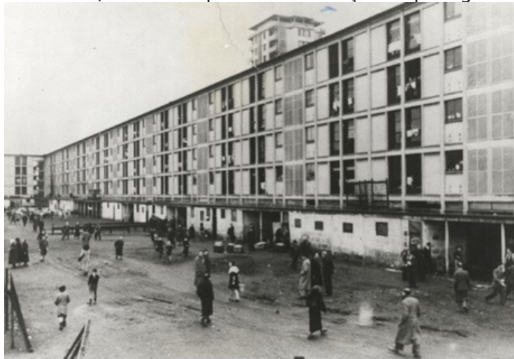
Figura 5 – Cité de la Muette, com o campo de concentração de passagem