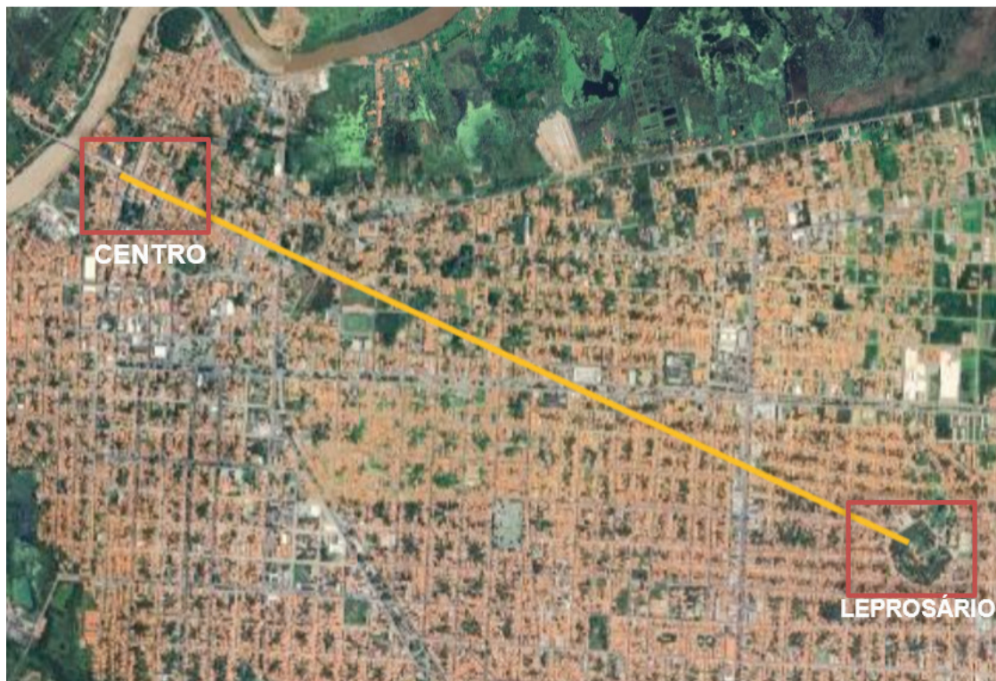
Figura 2 – Mapa da distância entre o centro e o leprosário