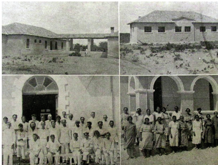
Figura 3 – Aspectos da Colônia do Carpina em 1939

Diante disso, revela-se a tentativa de reprodução, dentro da Colônia do Carpina, de uma microestrutura social que refletia, em certa medida, a vida fora do leprosário. A afirmação grifada sugere tanto a presença de elementos comuns à sociedade externa – como moradias, espaços de lazer, comércio e serviços públicos – quanto a manutenção das desigualdades, condições e restrições que marcaram a experiência do confinamento. A organização espacial e funcional do leprosário evidencia um controle institucional rigoroso, centrado na figura do médico-diretor, cuja autoridade se manifestava sobre todos os aspectos da vida dos internos. Além disso, a separação dos espaços por critérios, como estado civil e gênero, a existência de cadeias internas e a imposição de barreiras ao contato com familiares demonstram que, apesar da tentativa de emular a sociedade extramuros, a colônia operava com um sistema disciplinar próprio, em que a liberdade era restringida e a experiência cotidiana era atravessada pelo estigma da hanseníase. A composição das imagens a seguir ilustra os primeiros anos de funcionamento da colônia, apontando sobretudo a participação predominantemente masculina.