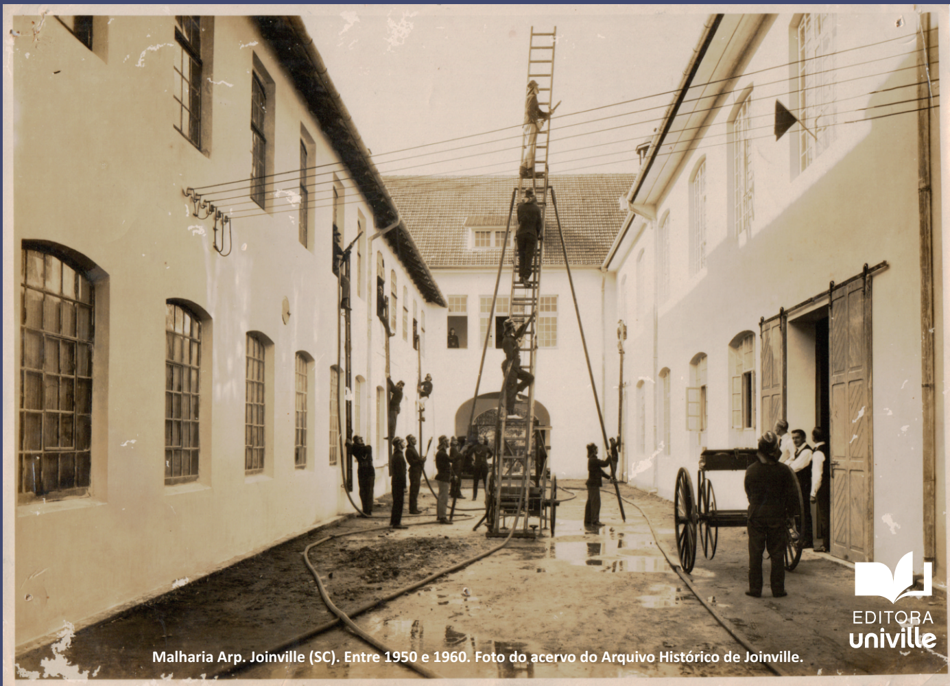
Malharia Arp. Joinville (SC). Entre 1950 e 1960.