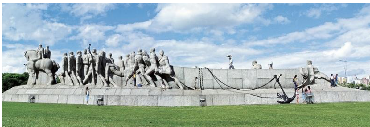
Figura 1 – Vista da obra Âncora , instalada no Monumento às Bandeiras. São Paulo, 2004

Intervenção não autorizada no Monumento às Bandeiras, em São Paulo. Também conhecido como Empurra-Empurra , foi esculpido em granito por Victor Brecheret e inaugurado em 1954. Construí uma âncora velha de navio e instalei o objeto, em plena luz do dia, no monumento modernista que representa o desenvolvimento de São Paulo. Mesmo sem a aprovação da prefeitura, a Âncora permaneceu três semanas no local. Durante uma tentativa de retirá-la, fui ironicamente impedido pela polícia que alegou defender o patrimônio histórico da cidade (SRUR, 2019a).