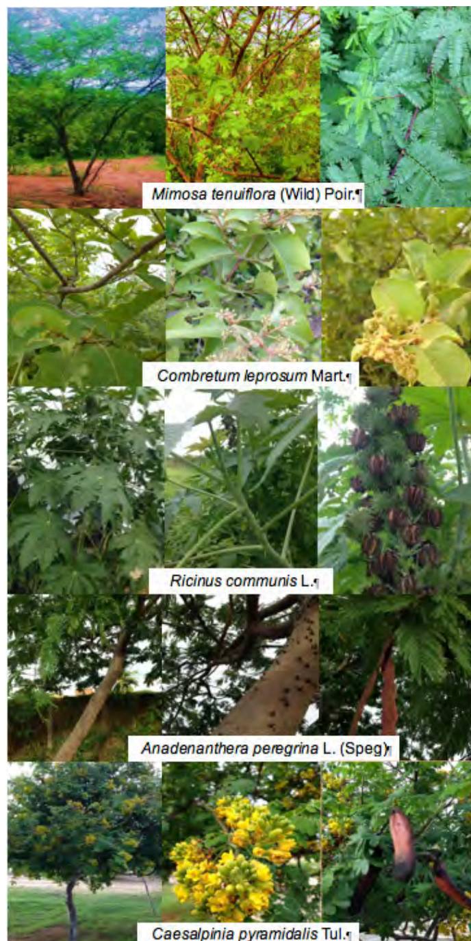
Figura 3 – Espécies nativas encontradas em maior quantidade e aspectos morfológicos, UFCG, Pombal, 2018.

No presente estudo, as espécies nativas da caatinga mais representativas foram: Mimosa tenuiflora (Wild) Poir., Combretum leprosum Mart., Ricinus communis L., Anadenanthera peregrina L. (Speg) e Caesalpinia pyramidalis Tul., dispostas na figura 3.