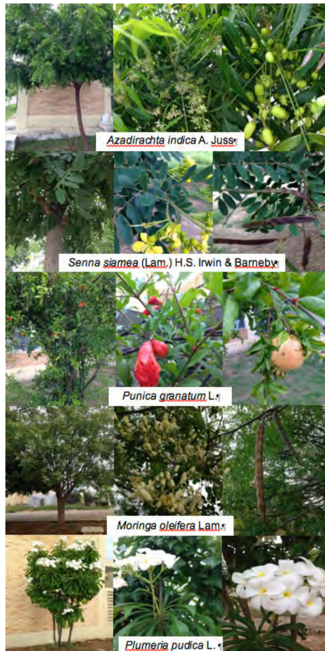
Figura 2 – Espécies exóticas encontradas em maior quantidade e aspectos morfológicos, UFCG, Pombal, 2018.

Segundo Alvarez et al. (2012), espécies exóticas acabam agravando o processo de degradação e desertificação nas áreas urbanas, ao invadir o bioma da caatinga e ganhar ao competir com as espécies nativas. Zea et al. (2015) analisaram a diversidade da arborização urbana do município de Santa Helena, no semiárido paraibano, e também observaram a frequência elevada de espécies exóticas, em especial nim, indicando desvalorização da flora nativa pela população.