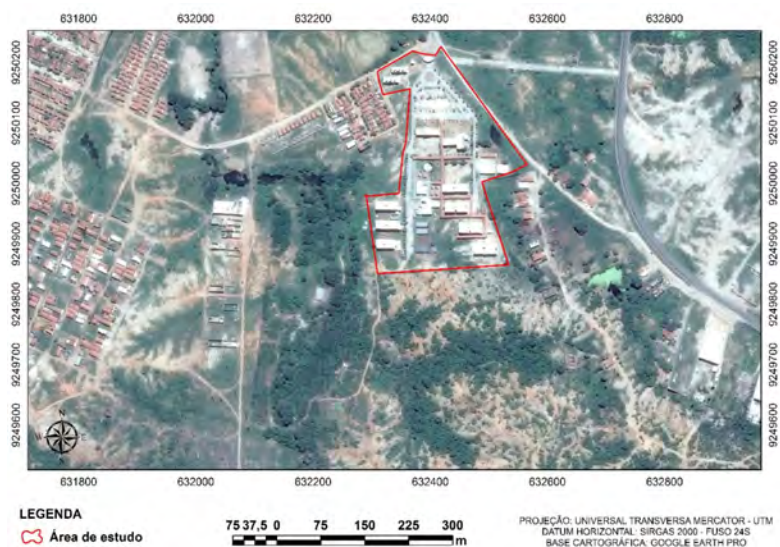
Figura 1 – Localização da área urbanizada da Universidade Federal de Campina Grande, campus Pombal, 2018.

O presente estudo foi realizado no Centro de Ciências e Tecnologia Agroalimentar da UFCG nas dependências da área urbanizada da faculdade (figura 1). O município de Pombal está situado na região oeste do estado da Paraíba, sob as coordenadas geográficas 06°46' S, 37°48' O e altitude de 148 m.