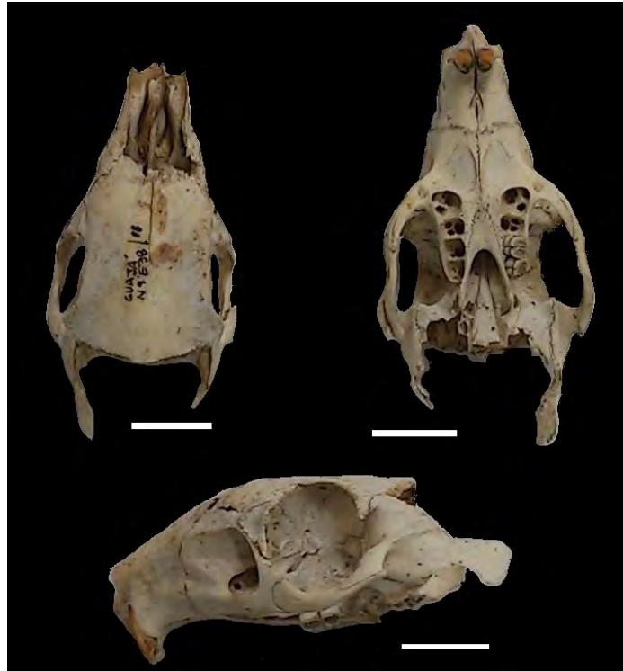
Figura 2 – Caixa craniana de Dasyprocta sp. (cutia). Escala: 2 cm.