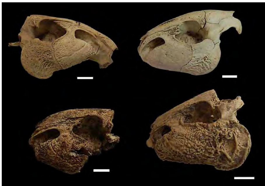
Figura 4 – Caixas cranianas de Cuniculus paca ( paca ). Acima, indivíduos jovens adultos; abaixo, adultos idosos. Escala: 20 mm.

Uma paca adulta pode ultrapassar os 10 kg e tem o crânio característico, marcado pelo arco zigomático desenvolvido, robusto, expandido lateralmente (figura 4). Essa característica também ajudou a definir a idade dos roedores entre jovens adultos e adultos idosos; nos últimos o arco zigomático é mais enrugado (figura 4).