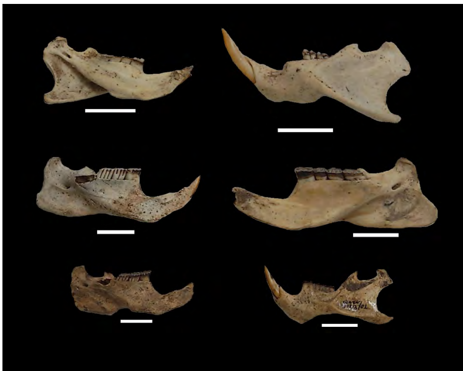
Figura 7 – Mandíbulas de roedores de grande porte. Escala: 20 mm.

O cálculo do número de indivíduos foi baseado em partes de crânio características (como o arco zigomático de pacas) e caixas cranianas completas, cujo material era possível de ser identificado com segurança. Quanto às mandíbulas (figura 7), também úteis para identificação, muitas se encontravam sem dentes ou fragmentadas, e isso resultou em muitos itens indeterminados.