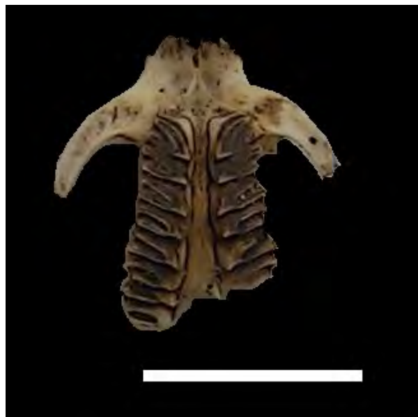
Figura 5 – Fragmento de maxila de Caviidae indeterminado. Escala: 20 mm.