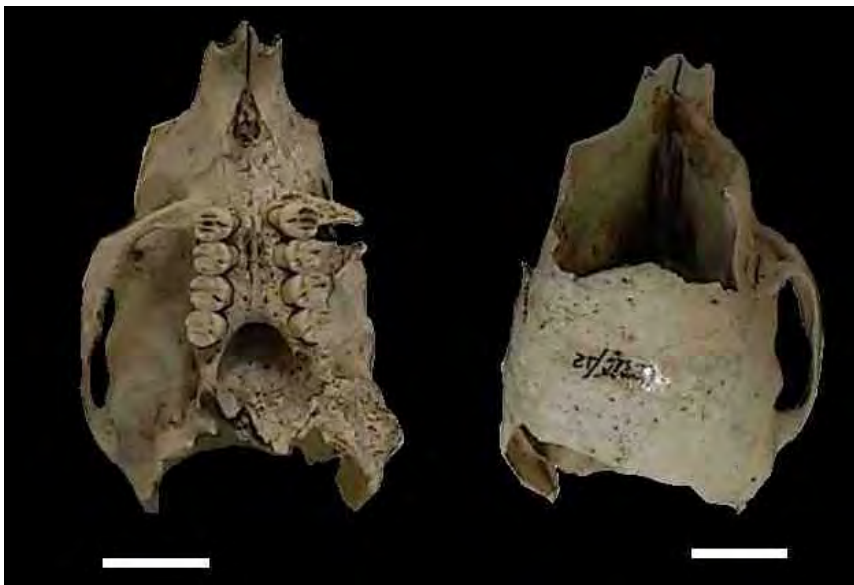
Figura 3 – Crânio fragmentado de Coendou prehensilis (porco-espinho). Escala: 20 mm.

A família, originária da América do Sul, é conhecida como porco-espinho do Novo Mundo. São roedores normalmente arborícolas, com uma grande cobertura de espinhos misturados aos pelos, e possuem o crânio arredondado, se comparado com os de cutia e paca.