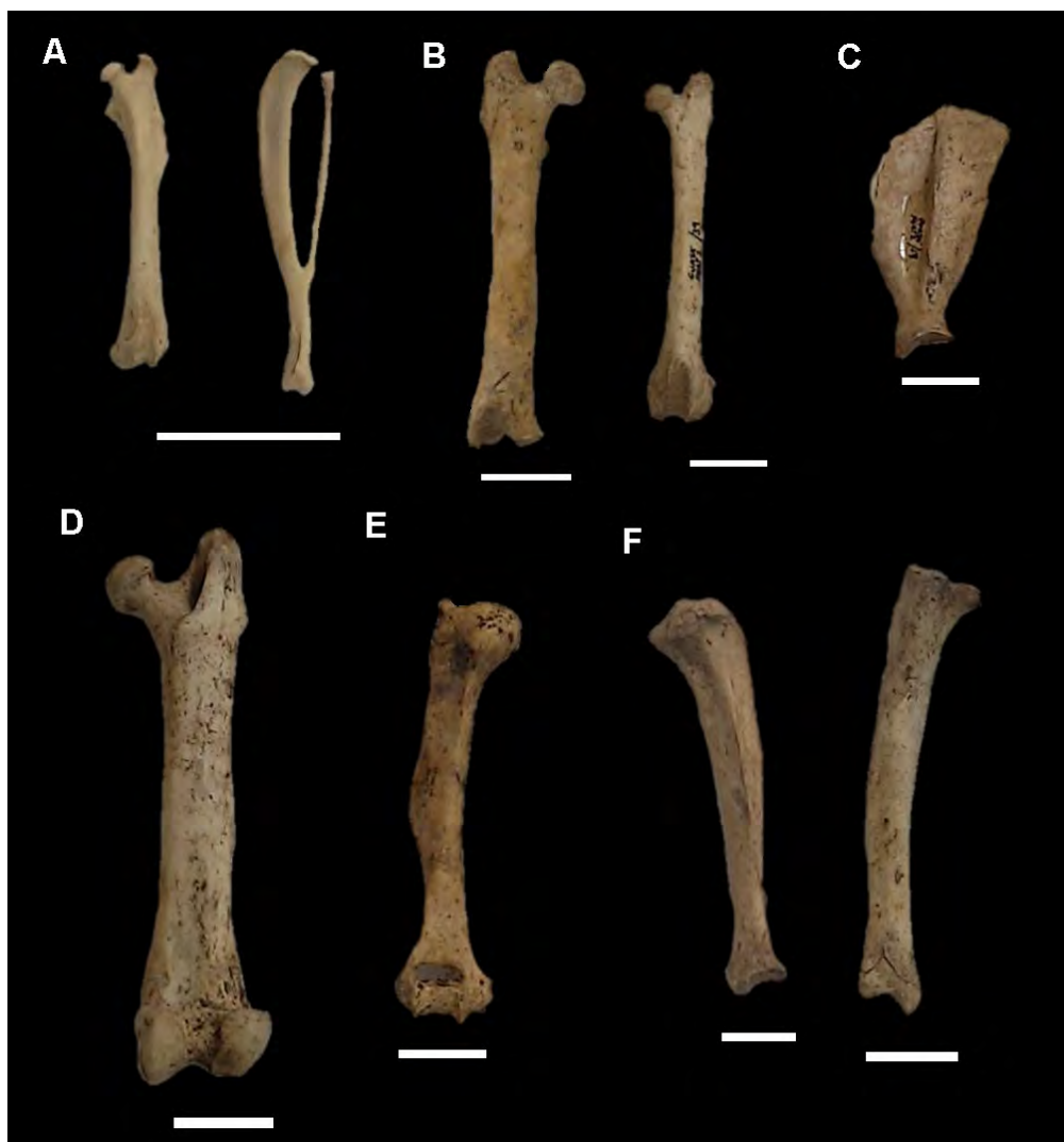
Figura 6 – Ossos apendiculares de roedores. A: fêmur e tíbia-fíbula de pequeno roedor indeterminado; B: fêmures de diferentes tamanhos de Dasyprocta sp.; C: escápula de Dasyprocta sp.; D-F: fêmur, úmero e tíbias de Cuniculus paca . Escala: 20 mm.