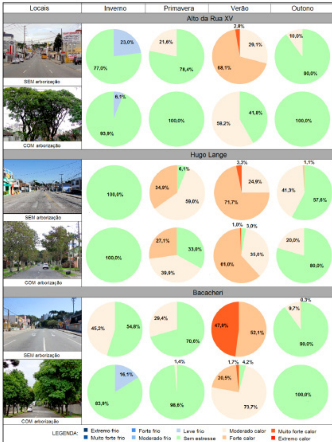
Figura 2 – Tempo de permanência nas classes de estresse das ruas arborizadas e sem arborização em cada amostra e estações do ano.

Observa-se que a rua arborizada com tipuana, em todas as estações do ano, teve maior duração de conforto térmico. Na estação do inverno, o tempo de permanência na classe de conforto da rua arborizada foi 16,9% maior do que na rua sem arborização, na primavera 21,6%, no verão 41,8% e no outono 10,0%.